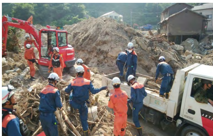
土砂排除活動の様子 【安芸郡坂町】