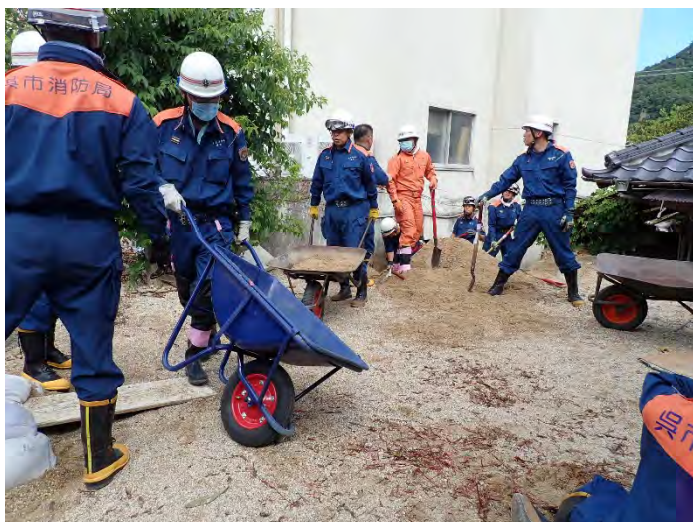
土砂排除活動の様子 【呉市】