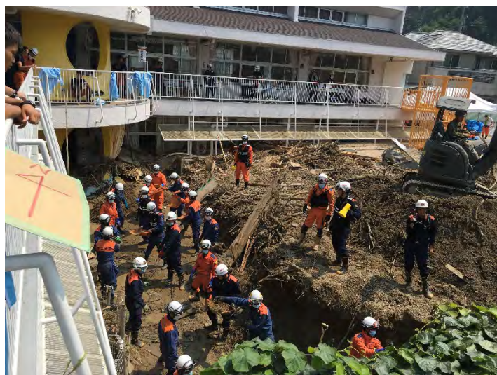
土砂排除活動の様子 【広島市】