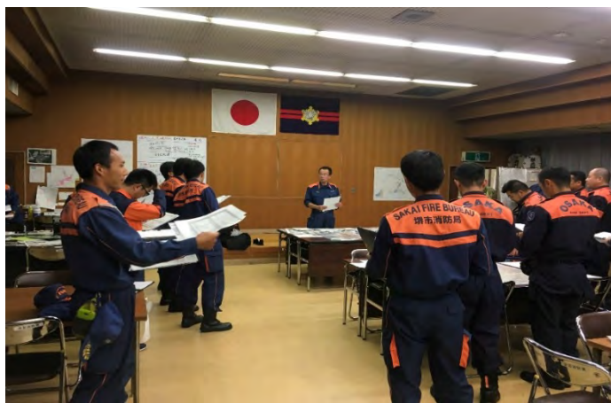
活動調整会議の様子 【広島市】