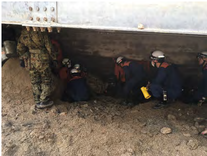
搜索活動の様子 【広島市】