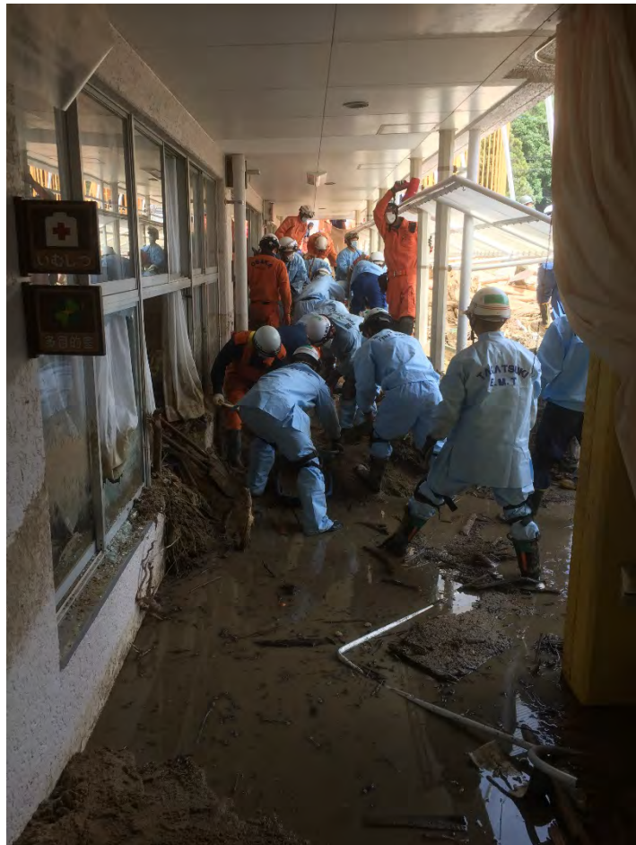
土砂排除活動の様子 【広島市】