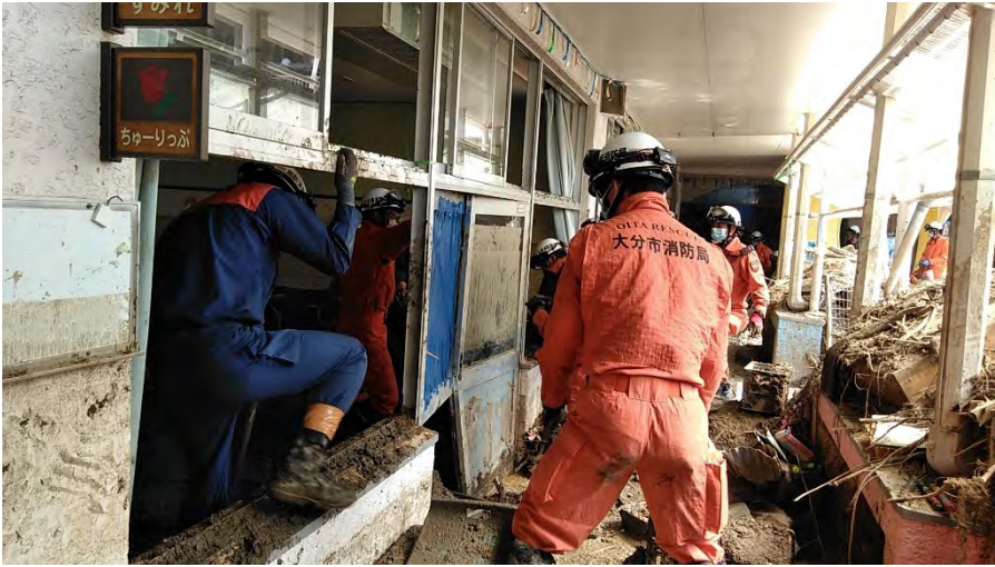
土砂排除活動の様子 【安芸郡坂町】