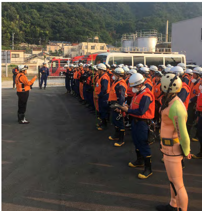
ミーティングの様子 【広島市】