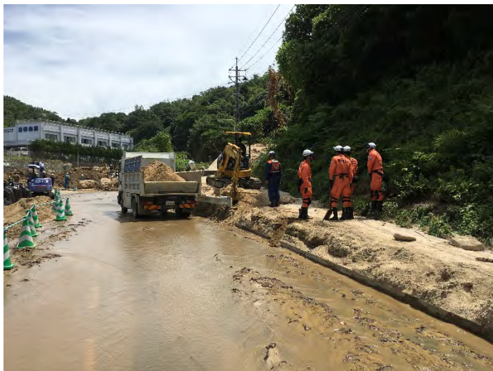
搜索活動の様子 【広島市】