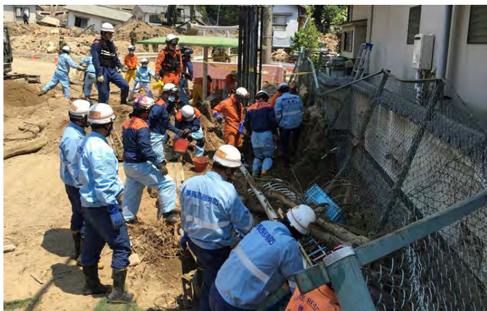
土砂排除活動の様子 【安芸郡坂町】