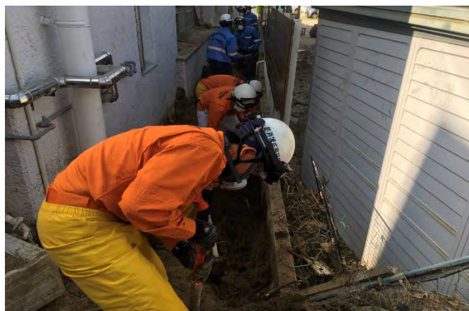
土砂排除活動の様子 【安芸郡坂町】