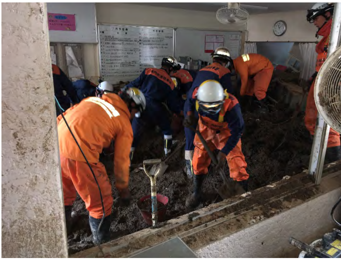
土砂排除活動の様子 【安芸郡坂町】