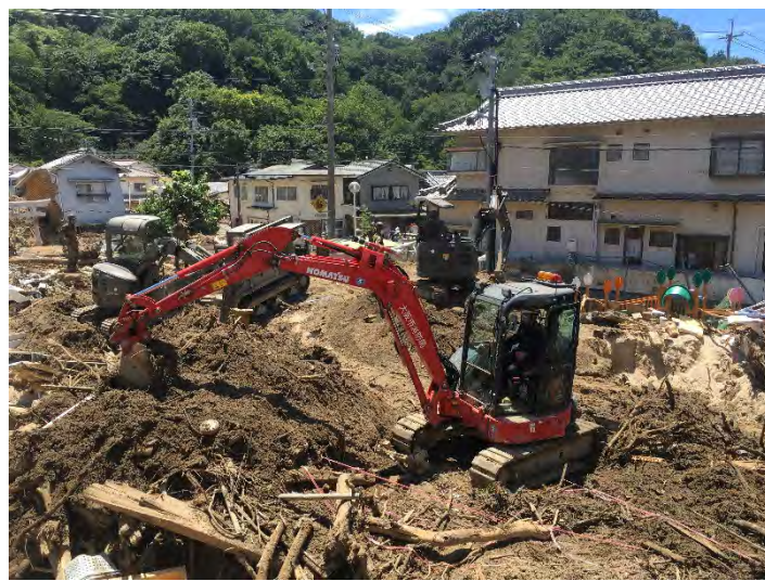
土砂排除活動の様子 【広島市】