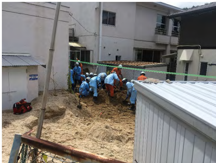
土砂排除活動の様子 【安芸郡坂町】