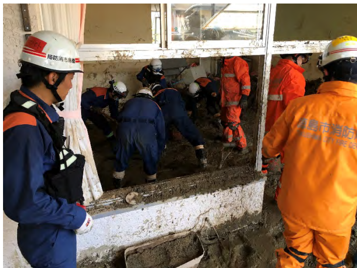
土砂排除活動の様子 【広島市】