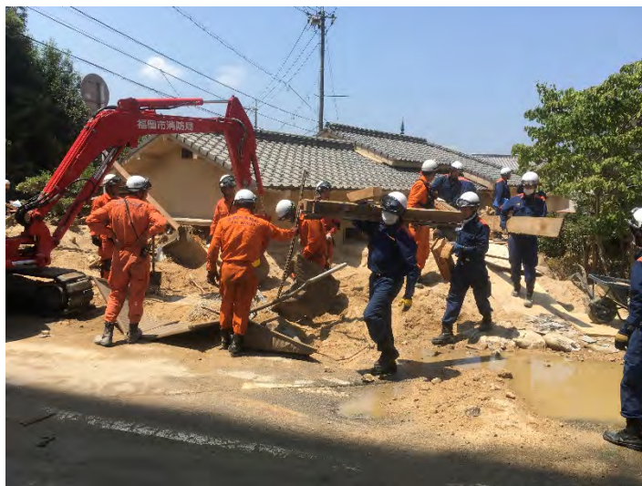
土砂排除活動の様子 【広島市】