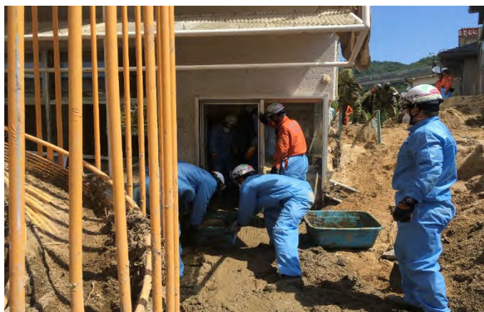
土砂排除活動の様子 【安芸郡坂町】