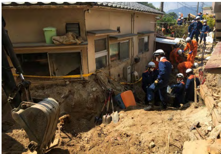
土砂排除活動の様子 【安芸郡坂町】