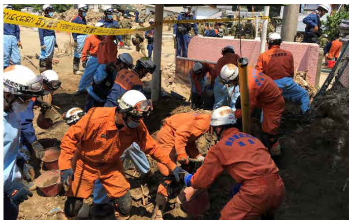
土砂排除活動の様子 【安芸郡坂町】