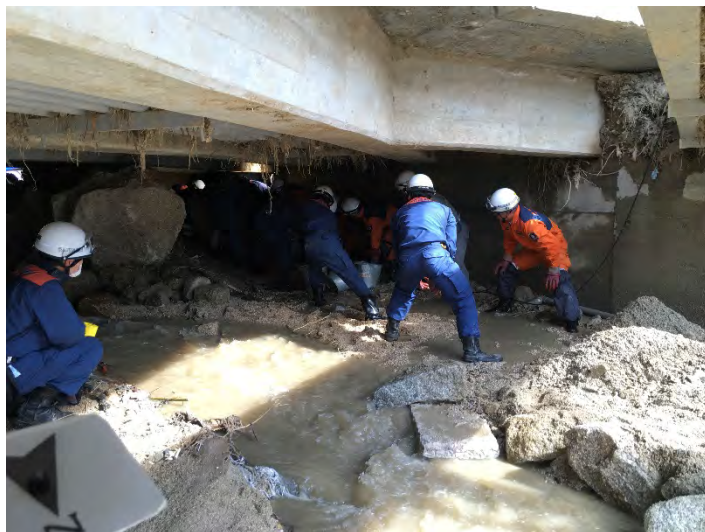
捜索活動の様子 【広島市】