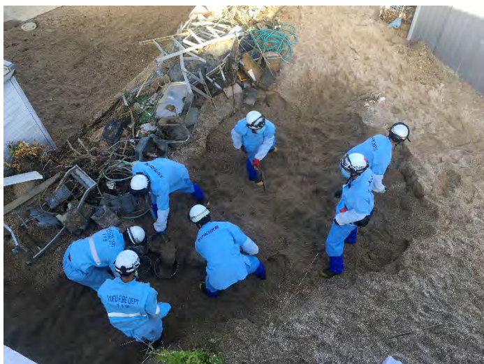
土砂排除活動の様子 【安芸郡坂町】