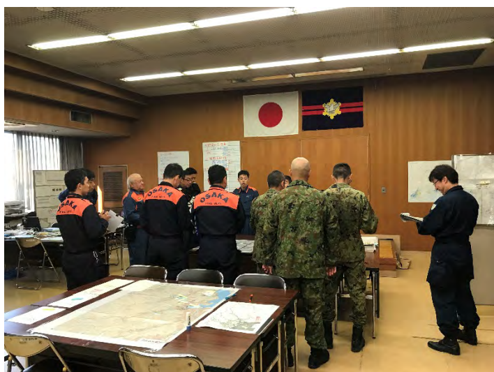
作戦会議の様子 【広島市】