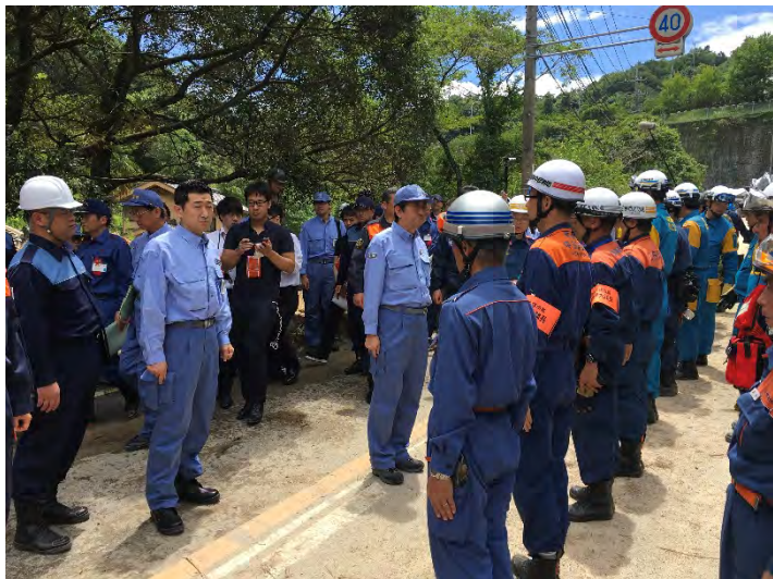
総理視察の様子 【広島市】