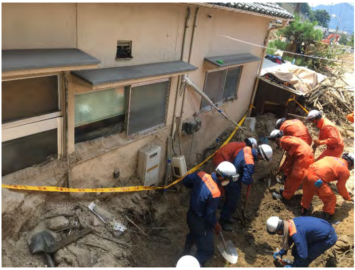
土砂排除活動の様子 【安芸郡坂町】