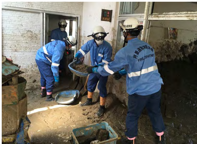
土砂排除活動の様子 【安芸郡坂町】