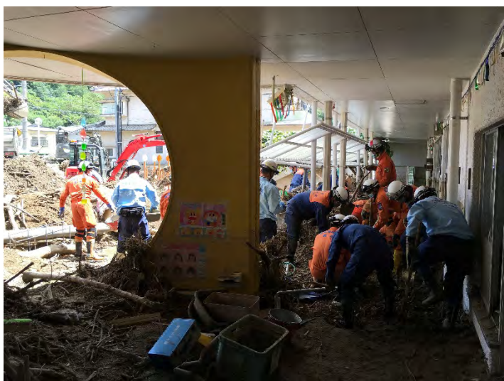
土砂排除活動の様子 【安芸郡坂町】