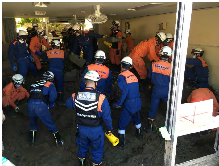
土砂排除活動の様子 【広島市】