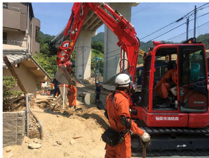
土砂排除活動の様子 【広島市】