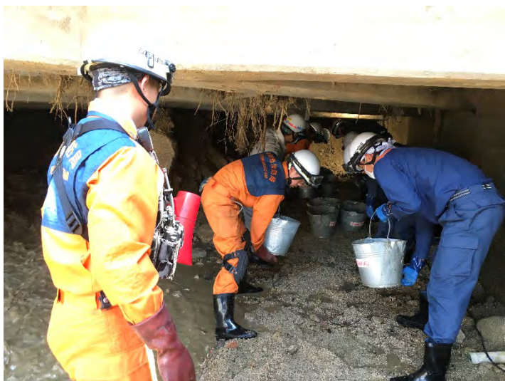
土砂排除活動の様子 【広島市】