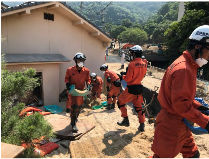
土砂排除活動の様子 【安芸郡坂町】